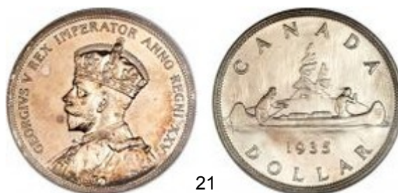
21 - 1 dollar Jubilé d'argent – 1935 – Argent 800‰ – 23,3g – 36,06mm