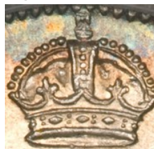
Couronne de Saint-Édouard Couronne Impériale

4 - 10 cents – 1902-1910 – Argent 925‰ – 2,32g – 18,03mm